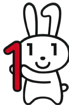
愛称：マイナちゃん