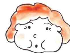
口をすぼめて ウー イー